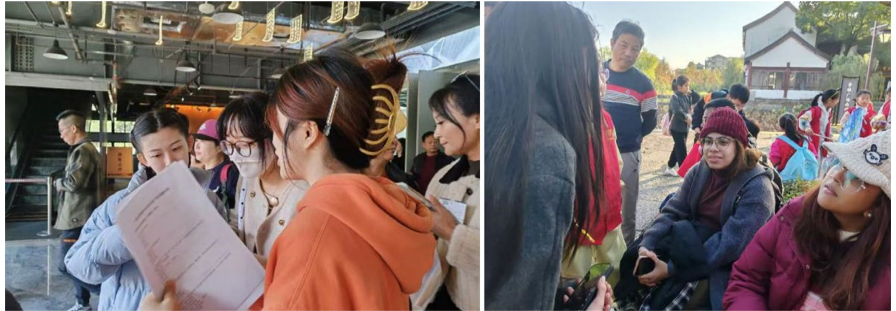
图 2. 线下实地调研

片和文章，吸引了大量国际网友的关注和点赞，粉丝数量已超过百万，成为推广绍兴文化的重要窗口。鲁镇大剧院大型情景话剧《鲁镇社戏》的演出，生动地传递了社戏的魅力和文化，其中不乏不少对鲁迅文学作品感兴趣的国际观众的欣赏观看，为国际传播提供新渠道。尽管面临语言障碍、传承人短缺和国际市场竞争等挑战，绍兴社戏的国际传播仍有广阔的发展空间。